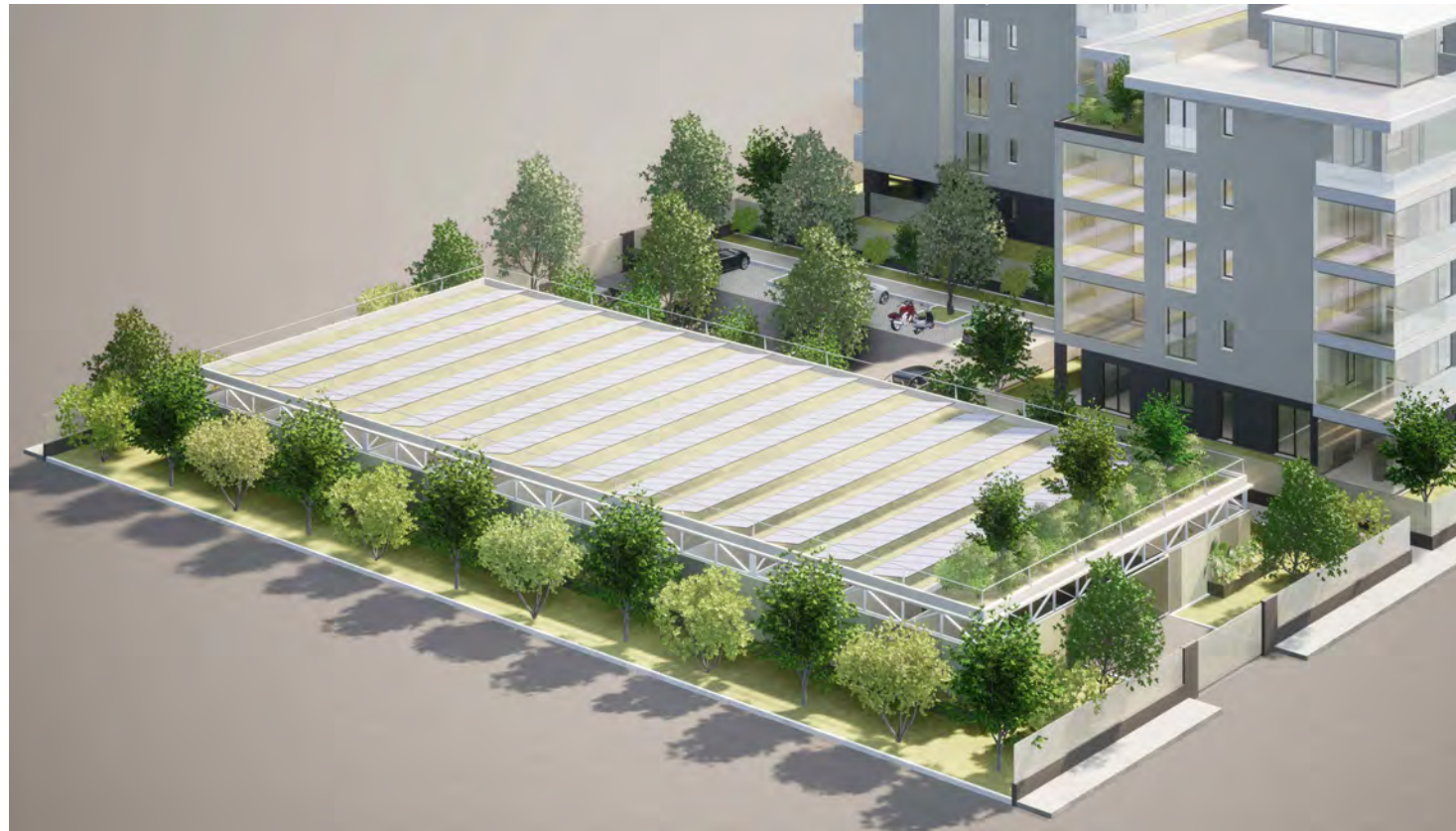
Edificio G (garage coperti)