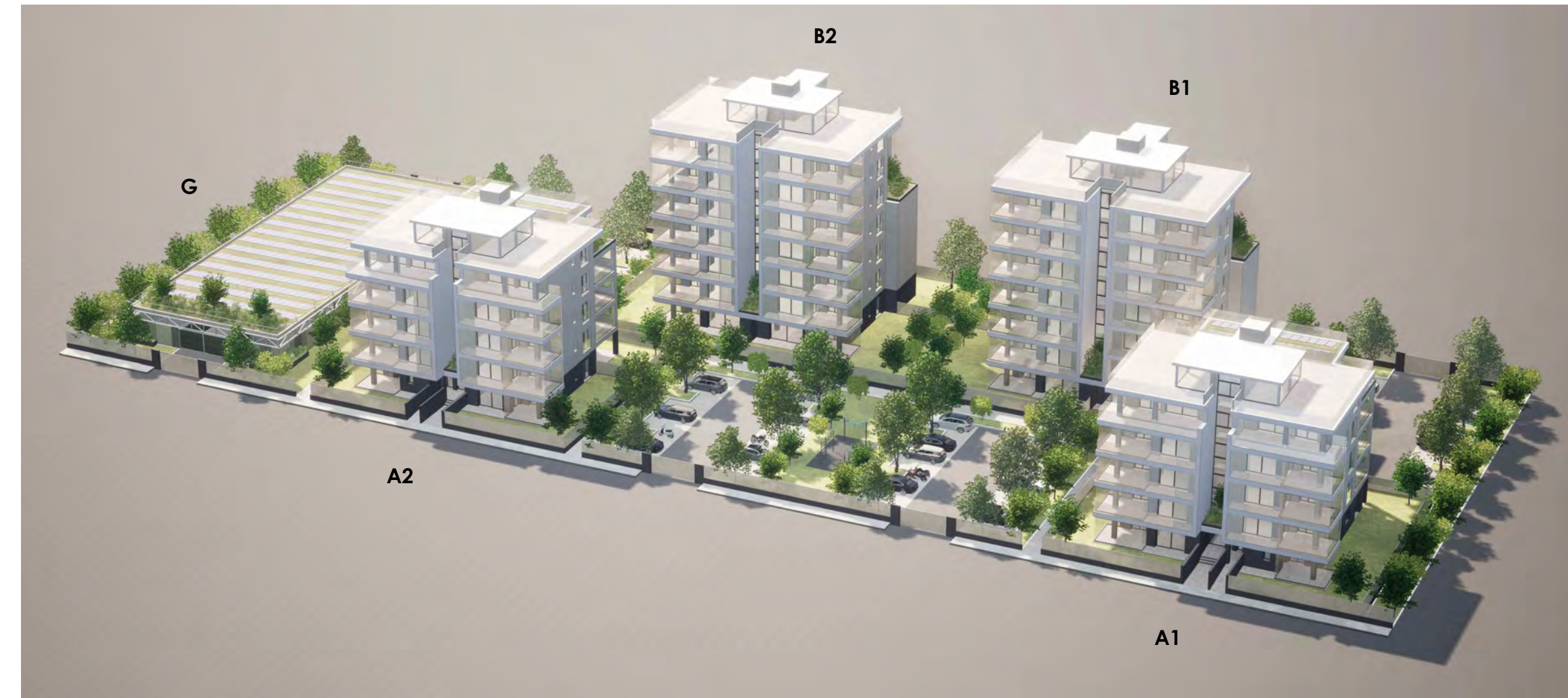
Vista aerea dell'intervento