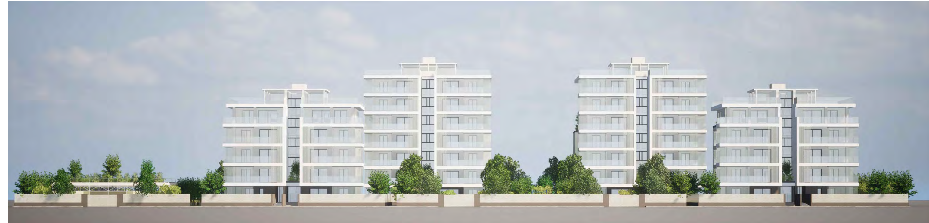
Profilo frontale dell'intervento