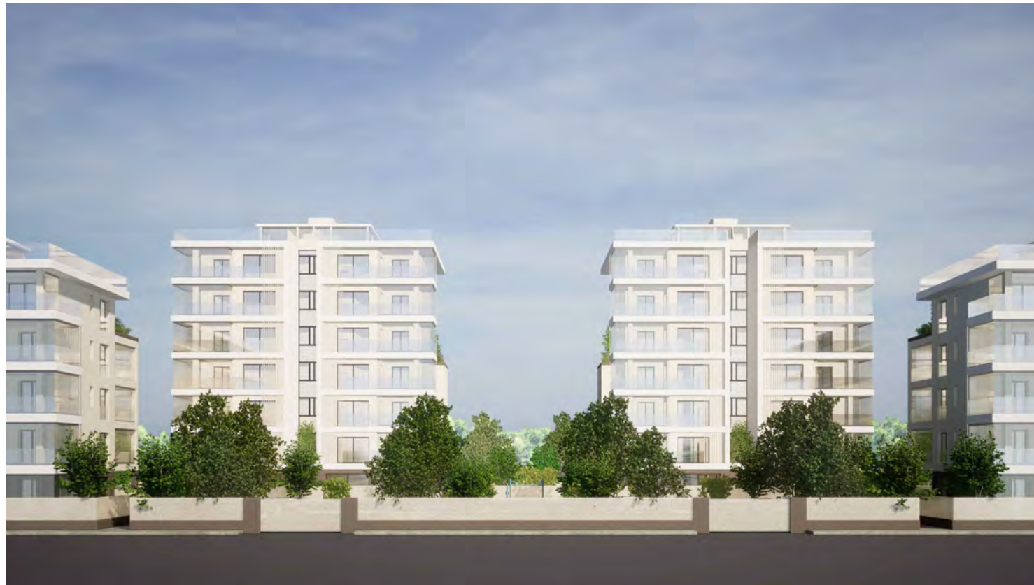
Edifici B1 e B2 (lato mare)