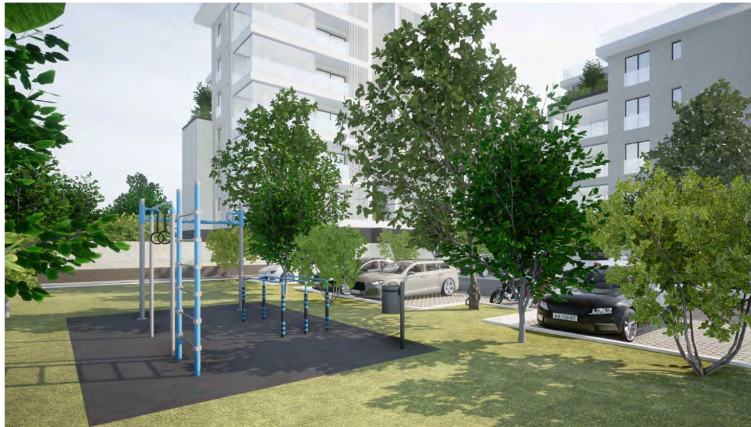
vista dal parco condominiale