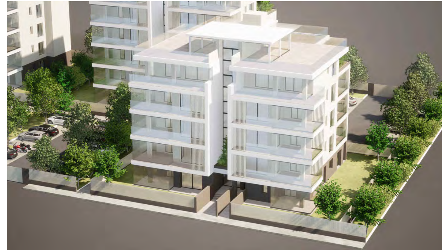
Edificio A1 (lato mare)