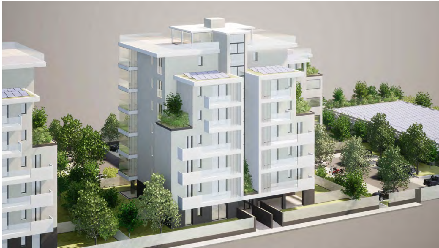
Edificio B2 (lato parco)