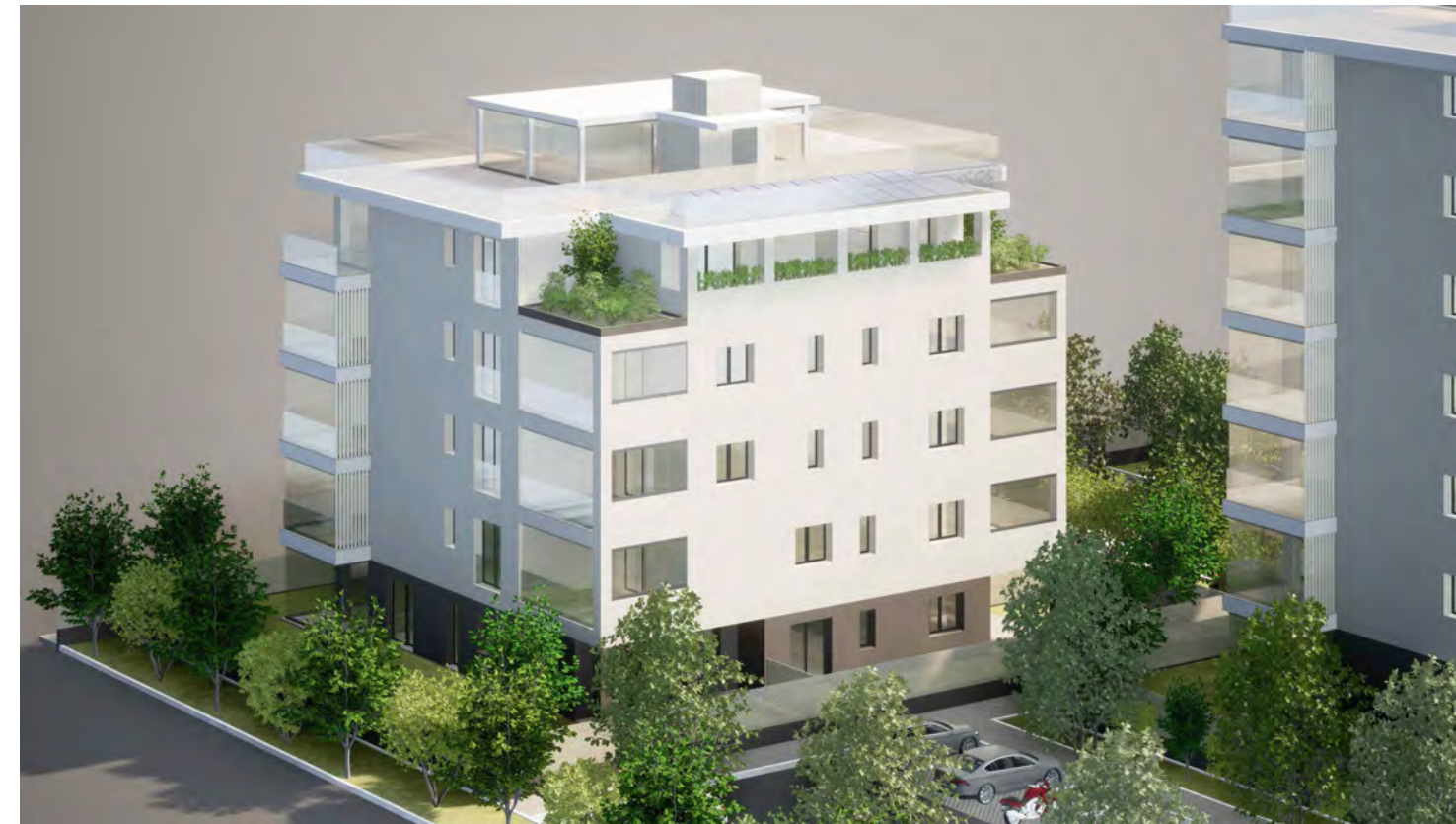
Edificio A1 (lato parco)